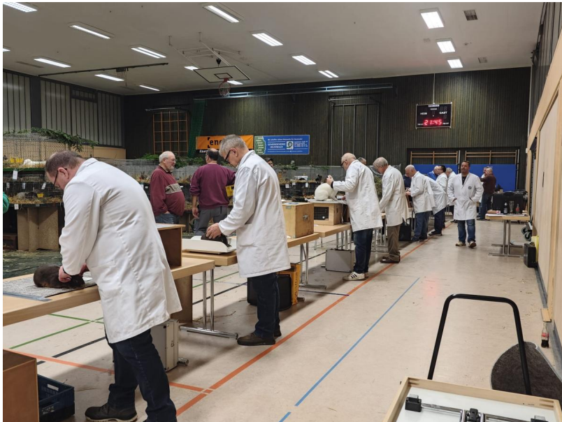
Bewertung der Tiere der auf der Landesschau