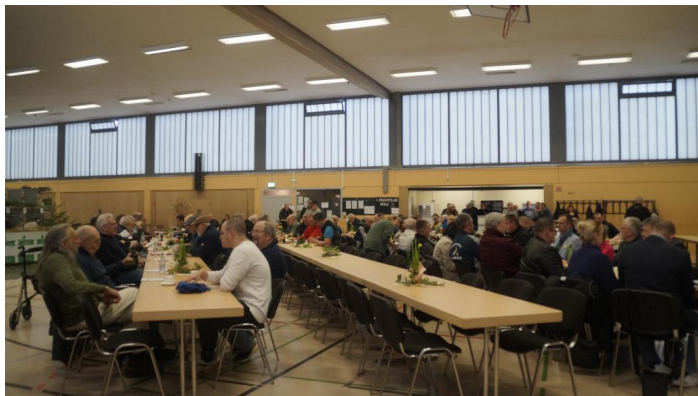
Eröffnungsfeier der Landesschau