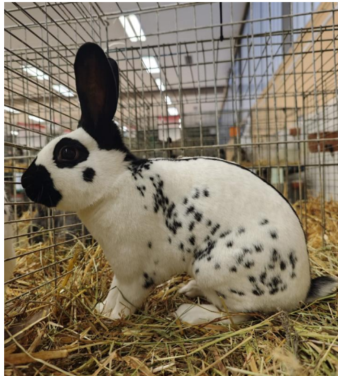
Englischer Schecke schwarz-weiß